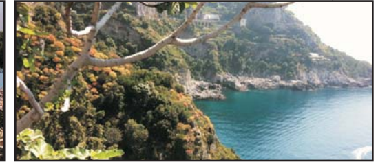
(Ravello, Amalfi, Positano, Sorrento, andata e ritorno, max 6 ore) (Ravello, Amalfi, Positano, Sorrento, round trip, max 6 hours)

CASSINO € 210,00 TOUR NAPOLI € 70,00 ROMA FIUMICINO € 360,00 VESUVIO € 100,00