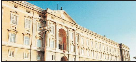
(Andata e ritorno e sosta di 2 ore per visitare la Reggia Vanvitelliana) (Round trip with 2 hours stop to visit the Royal Palace)

CASERTA € 110,00 ERCOLANO - POMPEI € 140,00 RAVELLO € 145,00 TOUR COSTIERA € 230,00