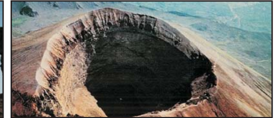
(Andata e ritorno e sosta di 2 ore per la visita al Cratere) (Round trip with 2 hours stop to visit the Crater)

PER OGNI ORA DI ATTESA EXTRA SI AGGIUNGE IL COSTO DI € 22,50 - CHARGE OF € 22,50 FOR EVERY HOUR EXTRA TIME TO WAIT