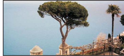
(Solo andata) (One way only)