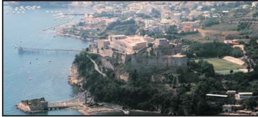
(Andata e ritorno e sosta di 3 ore per visitare il sito archeologico) (Round trip with 3 hours stop to visit the archaeological site)

BAIA € 90,00 ERCOLANO € 80,00 POSITANO € 130,00 SORRENTO € 110,00