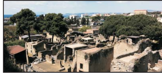
(Andata e ritorno e sosta di 2 ore per visitare il sito archeologico) (Round trip with 2 hours stop to visit the archaeological site)