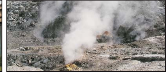
(Solo andata) (One way only)

BAIA € 90,00 ERCOLANO € 80,00 POSITANO € 130,00 SORRENTO € 110,00