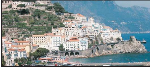
(Solo andata) (One way only)

AMALFI € 140,00 CUMA € 70,00 POMPEI € 100,00 SOLFATARA POZZUOLI € 50,00