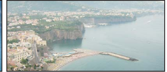
(Solo andata) (One way only)

CASERTA € 110,00 ERCOLANO - POMPEI € 140,00 RAVELLO € 145,00 TOUR COSTIERA € 230,00