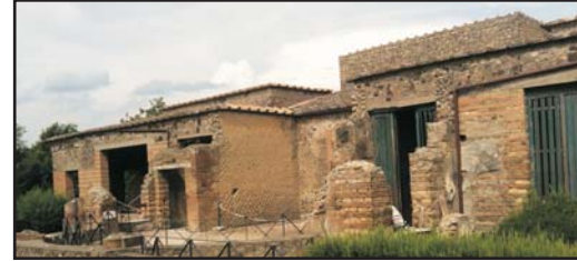
(Andata e ritorno e sosta di 2 ore per visitare il sito archeologico) (Round trip with 2 hours stop to visit the archaeological site)