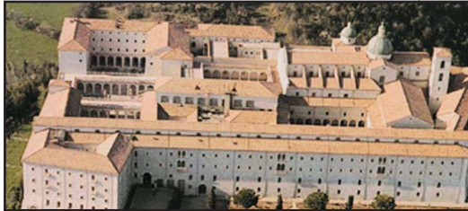
(Andata e ritorno e sosta di 2 ore per visitare l'Abbazia) (Round trip with 2 hours stop to visit the Abbey)

CASSINO € 210,00 TOUR NAPOLI € 70,00 ROMA FIUMICINO € 360,00 VESUVIO € 100,00