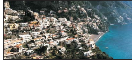
(Solo andata) (One way only)