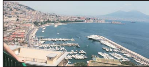
(Zona panoramica golfo e Campi Flegrei, Centro Storico) (Panoramic area gulf, Campi Flegrei, Historical Centre)