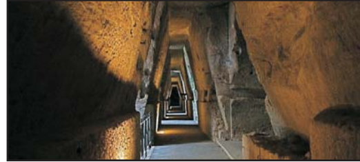
(Scavi archeologici, solo andata) (Archaeological site, one way)