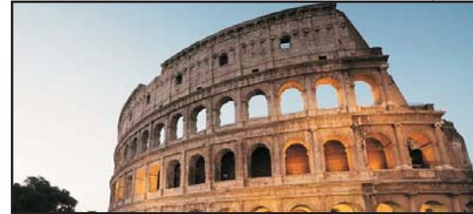
(Solo andata) (One way only)